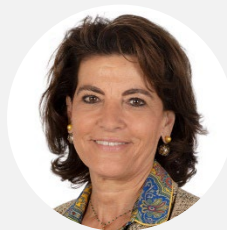
Dominique Estrosi Sassone