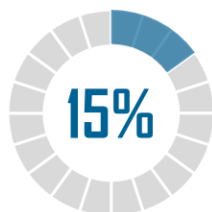
Taux de grossesses aboutissant à une interruption spontanée

Les partenaires ne sont pas épargnés : cherchant à soutenir leur compagne, beaucoup ne se sentent pas légitimes pour évoquer leur douleur. À la suite d'une interruption spontanée de grossesse, les symptômes anxieux et dépressifs s'établissent à des niveaux élevés chez les partenaires, quoiqu'inférieurs à ceux constatés chez leurs conjointes.