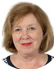
Catherine Deroche Sénatrice (LR) de Maine-et-Loire Présidente

En séance publique, le 29 juin 2023, le Sénat a définitivement adopté la proposition de loi ainsi modifiée.