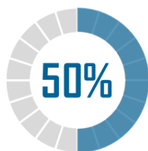
Taux de grossesses aboutissant à une interruption spontanée à 40 ans