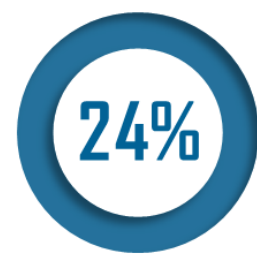
Part des centres de santé médicaux ou polyvalents gérés par des collectivités