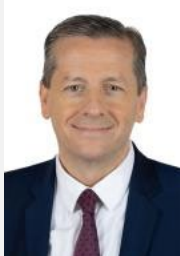
Bruno BELIN Rapporteur spécial Sénateur (Les Républicains) de la Vienne

Réunie à nouveau le jeudi 21 novembre 2024, sous la présidence de M. Claude Raynal, président, la commission a confirmé définitivement ses votes émis sur toutes les missions, tous les budgets annexes, tous les comptes spéciaux et les articles rattachés aux missions, ainsi que les amendements qu'elle a adoptés, à l'exception des votes émis pour les missions « Culture », « Direction de l'action du Gouvernement », « Enseignement scolaire », « Médias, livre et industries culturelles », « Audiovisuel public », « Recherche et enseignement supérieur », ainsi que des comptes spéciaux qui s'y rattachent.