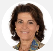
Dominique Estrosi Sassone Présidente

Sénateur des Alpes-Maritimes (Les Républicains)