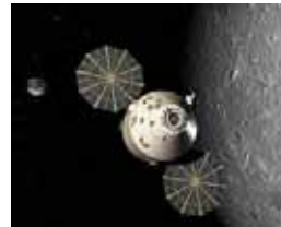
La capsule ORION (NASA)