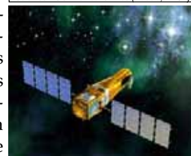
Satellite COROT (CNES)