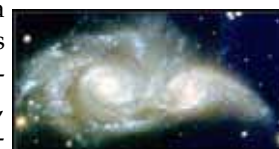
Galaxies NGC 2207 et IC 2163

Avec leurs capacités croissantes, les satellites de télécommunications et de télédiffusion peuvent prendre en charge l'Internet à haut débit, la télévision numérique haute définition, la télévision pour mobiles et la radio numérique, et participer à une diffusion large des nouvelles technologies audiovisuelles numériques. Il appartient à l'Europe d'imaginer de grands projets et de