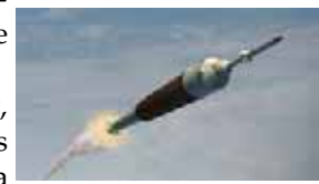
Ares-1 et Orion

Simultanément, grâce à ses revenus pétroliers et gaziers, la