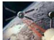
ATV en approche vers l'ISS (CNES)