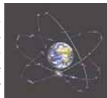
Constellation GALILEO (CNES)

Autre impasse actuelle, le spatial d'aujourd'hui est invisible . L'opinion ignore qu'une journée sans satellites serait une journée de chaos économique et social. Soumises à