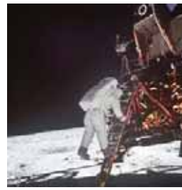
E. ALDRIN photo par N. ARMSTRONG-1969 (NASA)

Parce que le spatial s'affirme comme un outil militaire irremplaçable pour l'observation, les liaisons avec les forces armées, l'écoute et l'alerte avancée, au point que les satellites militaires doivent eux-mêmes être protégés par de nouveaux systèmes spatiaux, les principaux Etats européens impliqués dans le spatial, en premier lieu, la France, l'Allemagne et l'Italie, doivent mettre en place des coopérations multilatérales restreintes pour avancer dans tous ces domai-