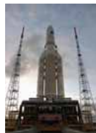
ARIANE-5 ECA (CNES)