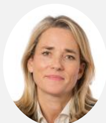
Céline Boulay-Espéronnier Rapporteuse Sénatrice de Paris (Les Républicains)