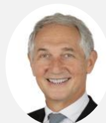
Bernard Fialaire Rapporteur Sénateur du Rhône (RDSE)

Commission de la culture, de l'éducation et de la communication http://www.senat.fr/commission/cult/index.html Téléphone : 01.42.34.23.23