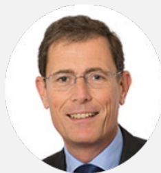
Laurent Lafon Président Sénateur du Val-de-Marne (Union Centriste)